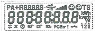
Тестовый режим. Активны все сегменты дисплея