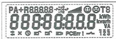
Тестовый режим. Активны все сегменты дисплея