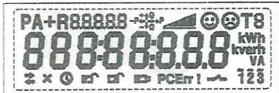
Тестовый режим. Активны все сегменты дисплея