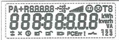
Тестовый режим. Активны все сегменты дисплея