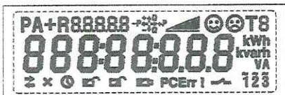
Тестовый режим. Активны все сегменты дисплея