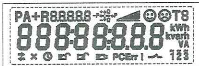
Тестовый режим. Активны все сегменты дисплея