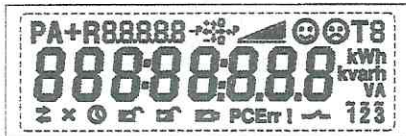
Тестовый режим. Активны все сегменты дисплея