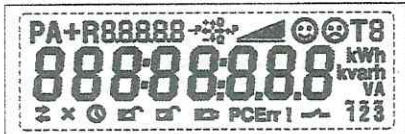
Тестовый режим. Активны все сегменты дисплея