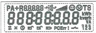
Тестовый режим. Активны все сегменты дисплея