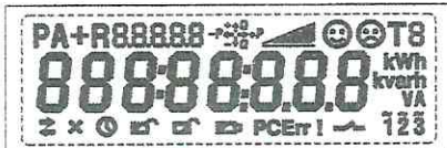
Тестовый режим. Активны все сегменты дисплея