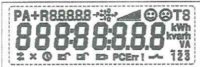
Тестовый режим. Активны все сегменты дисплея